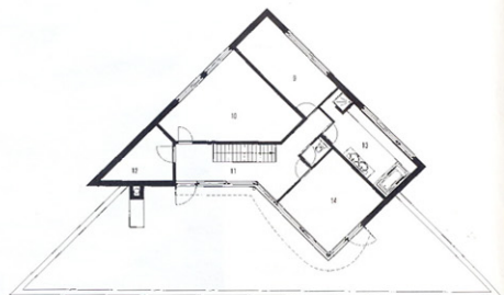
Plan de l'étage

La façade ouest nous permet de deviner l'entrée à gauche et de voir la fenêtre du bureau à droite.